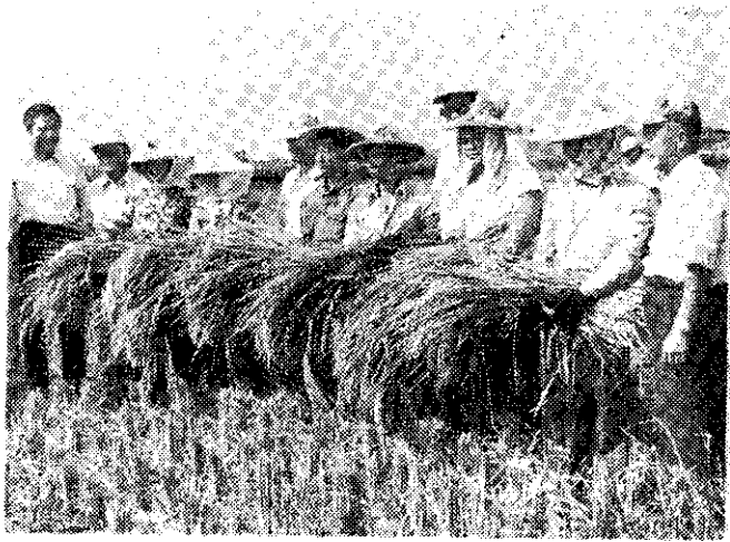
屏東縣竹田鄉一期稻收到(萬公)

嘉南地區的中間作直播田由於節省用水，播種都在積水狀態下進行。因此採用前項方法時容易發