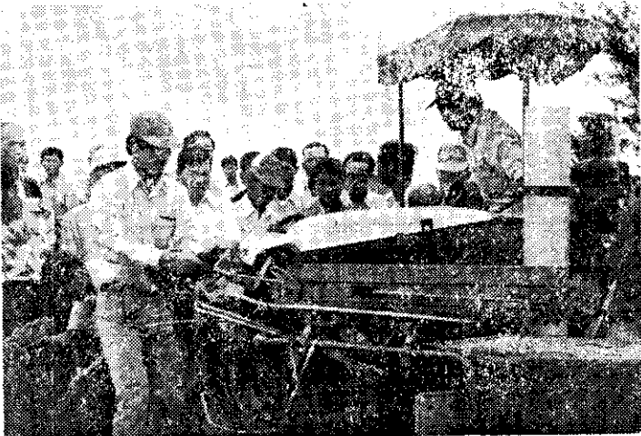
台南區農業改良場舉辦春作高粱機械採收觀摩會(榮)

修正省市六項地方自治法規，其中規定名冊漏列而經戶政機關查證，仍有投票權者，仍可投票。