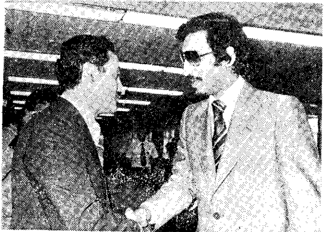
沙烏地阿拉伯米夏親王（右）來我國訪問

這艘巨無霸的輸油管路最大口徑為一公尺，全船的油須二三小時方能裝卸完畢。駕駛系統採全自動方式。