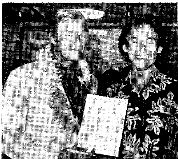
一名影星却爾斯希頓斯頓（左）來訪，影畫為他素描

一九七七年世界青棒賽的明星球員已經選出，中華青棒隊有三人入選，他們是外野手葉福榮、內野手李明志、捕手唐昭鈞。