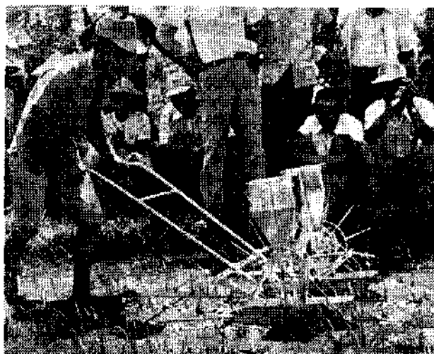
—高改良式水筒深層施肥機在桃園縣操作示範（中央社）—

果菜公司最近編印「果菜選銷」期刊及「主要蔬菜分級包裝簡要規格」，農民如果需要，請寫信到台北市水源路四〇一號，果菜公司企畫部索取。