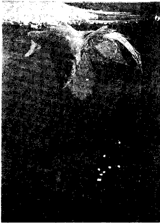
圖四：在浮巢下，公彩雀擁抱母彩雀產卵

美洲出名的鯉魚，在繁殖季節，公魚利用靠近水面的植物為基礎，將找得到的各種建築材料，用口腔分泌的黏液纏絡起來，造成管狀的巢，有前後兩個開口，造好巢後，公魚亦照例去追求母魚，使盡各種甜言蜜語勸誘，才把母魚請入巢中，公魚亦擠身而入，在巢中一陣劇烈的扭動後，在產卵的過程中，母魚會離巢休息後再回來產卵。這種魚本省很少見，但在美洲，它却因有趣的繁殖行為而家喻戶曉！