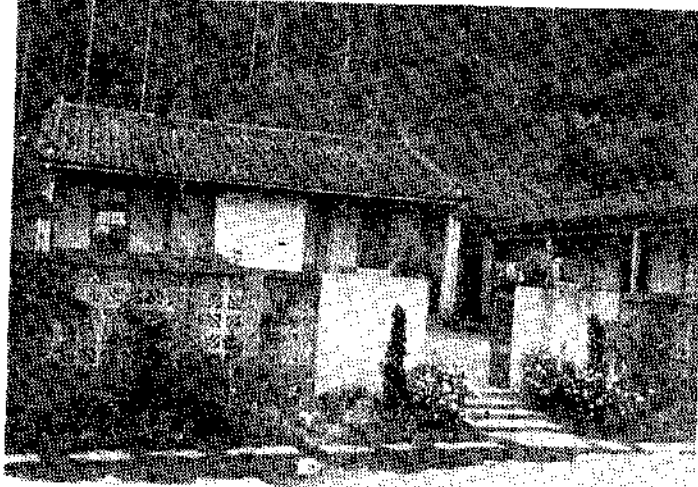
安祥寧靜的校舍 (林吉卿)

讓孩子保持祥和平靜的情緒，可使孩子養成合羣、樂觀、進取、仁愛的良好品德，有助於孩子學業進步，更有助於日後成人時事業的成功。