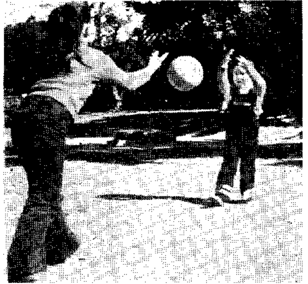
兩個孩子恰恰好 (阿芬)

王小姐：可是我聽朋友說，未生育過的婦女，如果服用口服避孕藥，以後會有不孕的可能。我們只想慢些生育而已，所以不敢採用口服避孕藥。 工作人員：這種傳說不正確，純為謠傳。如果口服避孕藥會造成不孕，我們決不會建議妳採用。