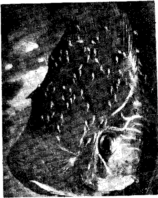
五彩神仙的子魚在親魚身上吸食皮膚分泌物

產完卵後，公母魚輪流在卵上方扇動水流，並用口清理魚卵。水溫二十六度C時，魚卵四天就可