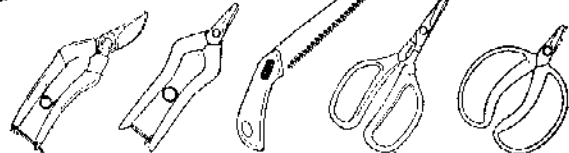
S 型剪定鋏 NO. 120S 採果鋏 NO. 310 工作鋏·剪定鋏 NO. PS18 葡萄鋏 NO. 320 採收鋏 NO. 400