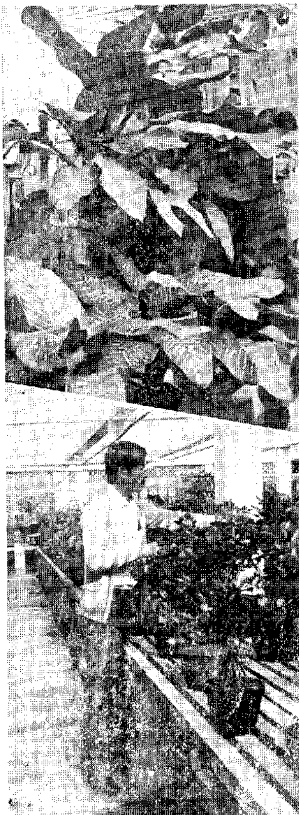
上：廣東萬年青 下：樹桔盆栽

廣東萬年青又名靈粉葉，是屬於天南星科植物，學名 Dieffenbachia Seguinæ Var. Nobilis Engler，一般郊種植在盆中，是一種很有名的室內觀賞植物。