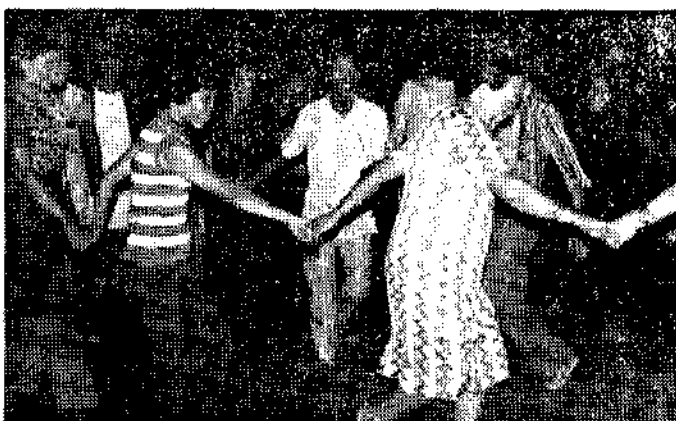
樹林鎮四健家政聯合會管中精彩的土風舞表演(陳榮滿)

省立北門農工職校爲提倡學生讀古風氣，培養閱讀英語興趣，新近成立會話班，由余文雄老師負責，利用中午休息時間指導。參加學生很多，配合動作演練，學起來很有趣。(胡聯)