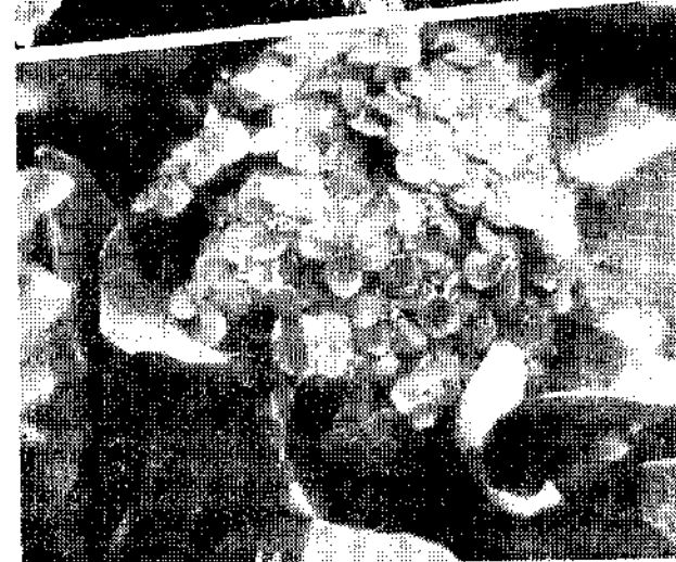
由上而下：中國蘭、彩葉草、仙丹（吳景祥）

檸檬、柑桔： 此類植物具有深綠色葉片，樹高六尺時，會產生芳香性花朵和果實，剪定可以使樹身矮化。此等植物耐寒力差，在寒冷地帶栽植時，冬天需有此護物，使平均溫度保持在攝氏八至一〇度。夏天則喜歡日照充足、通氣良好、水分濕潤之地。