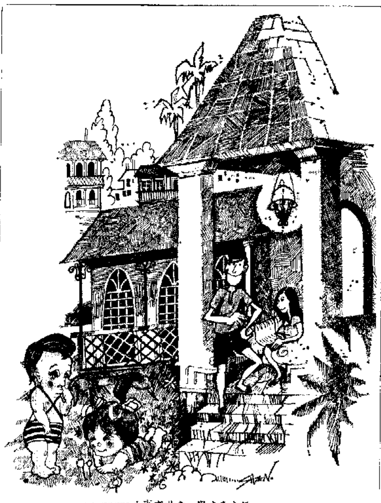
——生育有計畫，家庭真幸福——