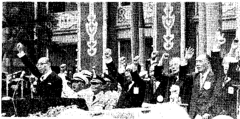
雙十國慶大會，嚴總統率領全國軍民歡呼