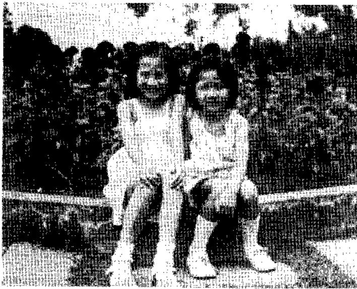
——姐妹花，真可愛（江生）——

「既然這樣，我跟我先生說說看了。今天真謝謝你給我這個好的建議。」李太太這時才展露出笑容。