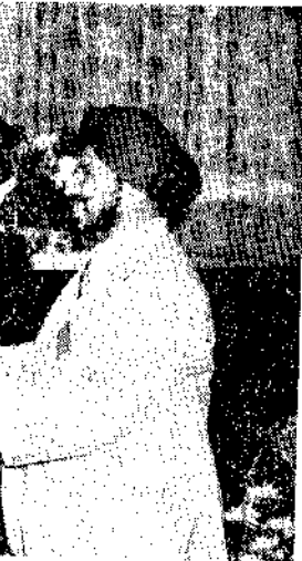
農復會主任委員頒給證書給土地改革所外國學員

台灣區果菜運銷公司編印的「第二期果菜運銷」免費贈閱。請寫信向：台北市萬大路五三三號果菜公司索取。