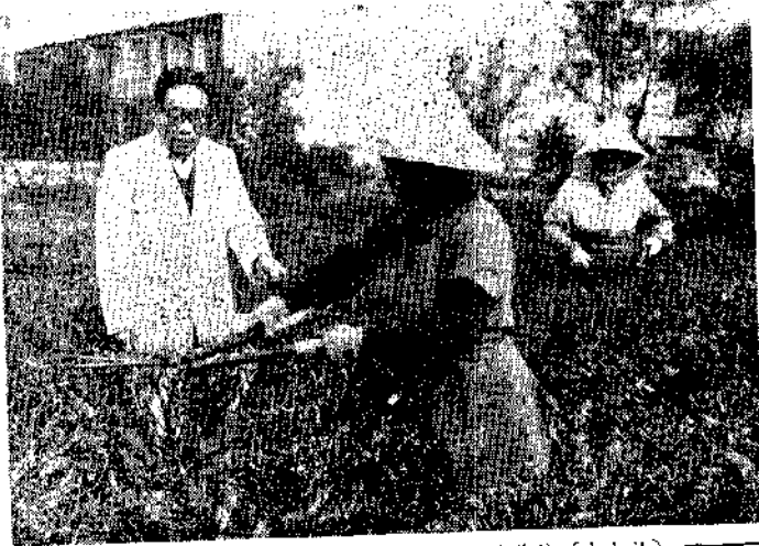
——中社訊——省農林廳長吳振輝與農會代表在茶園採茶後

省糧食局十二月一日開始分區發放六十七年第一期米谷米谷生產貸款，預定明年五月十日截止，貸款總額新台幣九億元。