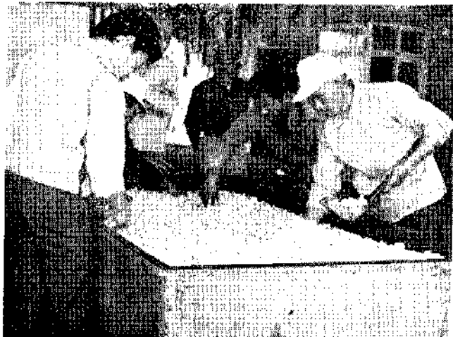
洋菇檢收後水洗(阿耶)