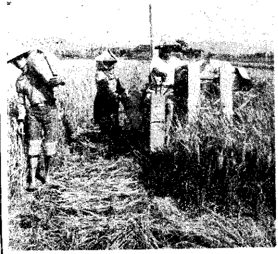
聯合收穫機割稻 (張瑞卿)