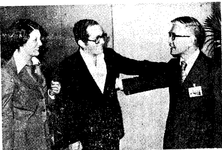
厄瓜多爾農牧部次長貝納艾瑞西於66年12月14日來訪

司法行政部調查局最近指出：檢肅匪諜工作，關係到國家的安全、社會的安寧，也和每一個人的生命財產，有不可分割的關連性。因此，社會大眾須協力合作，注意可疑事物，徹底擊敗共匪滲透顧覆的陰謀。