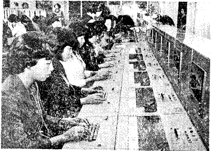
電信局新啓用中文電腦查號系統 (中央社)

敵後消息指出：北平、雲南、福建、海南島等地，最近出現反共組織及許多反共傳單。匪區鐵路中段一座水泥橋