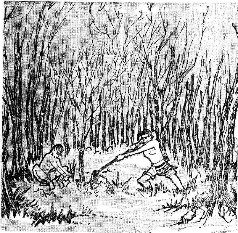
為了紀念篤目的事跡，山胞合力栽植埔鹽樹

後來為了紀念篤目的事跡，這兒的山地人合力栽植埔鹽樹，終於把卡拉社變成今日的埔鹽林了。