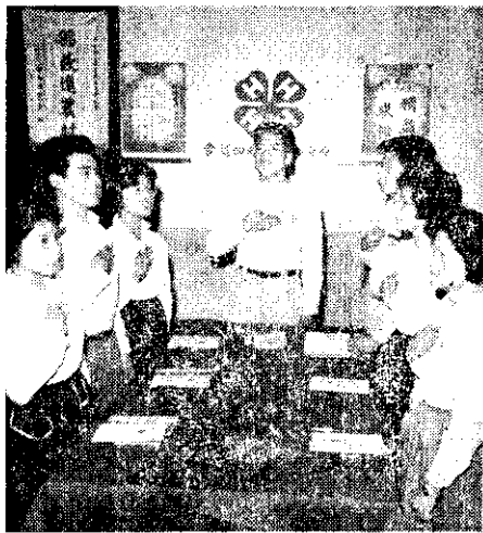
四健會會員宣讀四健會公約

香水樹在國外，是一種高收益的山坡地經濟作物。目前本省有些農家想不出適當的作物栽培，不妨試試香水樹。