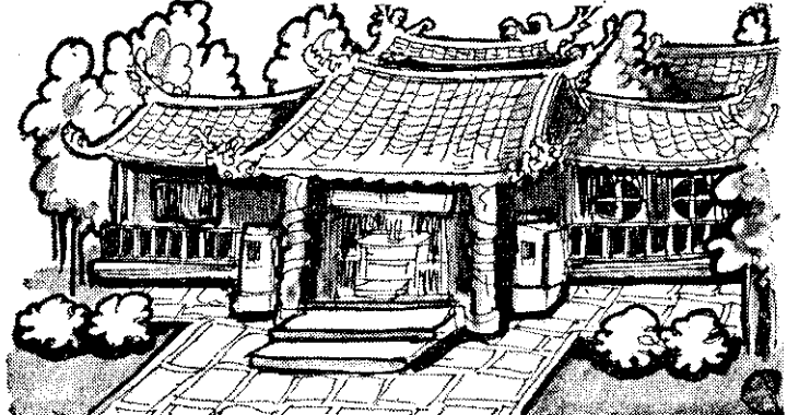
本省各地廟宇很多，但有幾座比較特殊

曹謹到任以後，發現了興建水利設施的重要，於是召集地方鄉紳，招請工匠，開鑿了一條長達四○三六○丈的圳渠，引來下淡水溪的水，做為灌溉之用。圳渠、水塘鑿好之後，受益稻田足有三五○多甲。鳳山當地農村獲得水利保障，年年豐收，過幾年，忽然又來了一場更嚴重的旱災，圳水仍然不夠用，曹謹於是又督導地方人士，再增