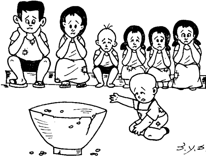
孩子多，麻煩多。孩子少，幸福多。(應訓)

今後推行家庭計畫工作，重點目標必須放在這些高出生率的偏遠地區，及針對觀念守舊的人而努力，如何讓他們了解子女少幸福多，