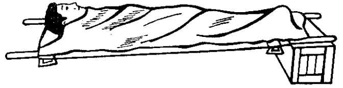
圖二：治療休克的位置

小的穿刺傷大多血流不厲害，但是大的穿刺傷往往有嚴重的內出血，所有的穿刺傷都很容易發炎。