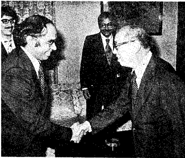
嚴總統接見沙國商業部長哈姆丹