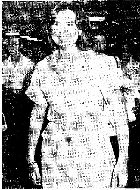
美國一九七八年棉花皇后哈克4月27日來訪(中央社)