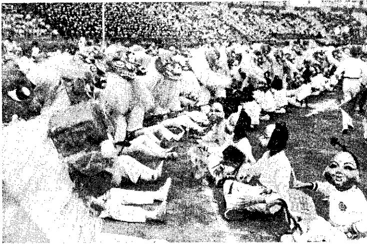
台北中國小運動會，日新國小5月11日表演百獅獻瑞