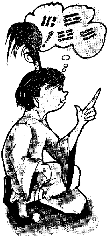
左慈自幼聰穎過人，伶俐可愛

「這是千真萬確的，我絕不是騙你，因為我看得出來你的身體四周籠罩著一團晦氣。」左慈詳作解釋。