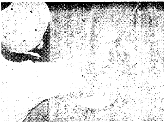
仔牛之乳乳(片張特)

七·早期離乳精料配合比例：尿素一%，玉米三七%，大豆餅一七%，酵母粉八%，魚粉五%，葡萄糖五%，塩及礦物質一%，甘肅一五%