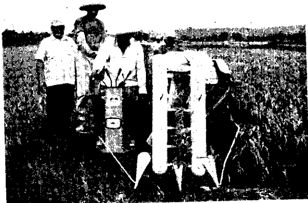
上：高粱聯合收穫機 中：牽引機 下：水稻聯合收穫機

引機與其附屬農機具補助售價之一〇%。其他新型農機，補助不超過售價之二〇%。（以經濟部農機基金會推行小組核准爲限）。