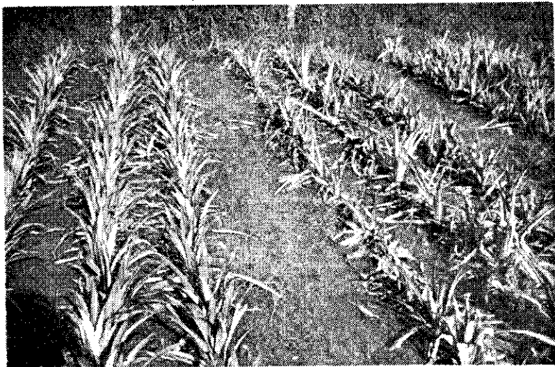
田間心腐病發生情形(左)健全區(右)發病區

9. 若田間發生心腐病，可用以上藥劑任選一種，稀釋四〇〇倍，灌入鳳梨心部，每株一〇〇c.c.於種植及二〇、四〇、六〇天各施用一次，連續三次。