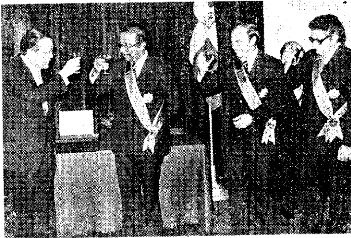
外交部長贈勳多明尼加農學部長梅希亞(右二)等人

中華民國各農學團體於十二月九日在台北市舉行六十七年度聯合年會，討論中心議題是「如何提高農民所得」。各農學團體聯合年會是於十二月九日在橋光堂舉行，並分別展開學術活動。