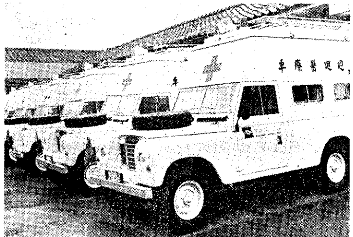
衛生署購置巡迴醫療車6輪，加強偏遠地區醫療服務

內政部十一月八日決定：自明年七月開始，採「服務到家」的方式，全面換發戶口名簿。換發的工作，須六個月的時間，計畫至明年底完成。