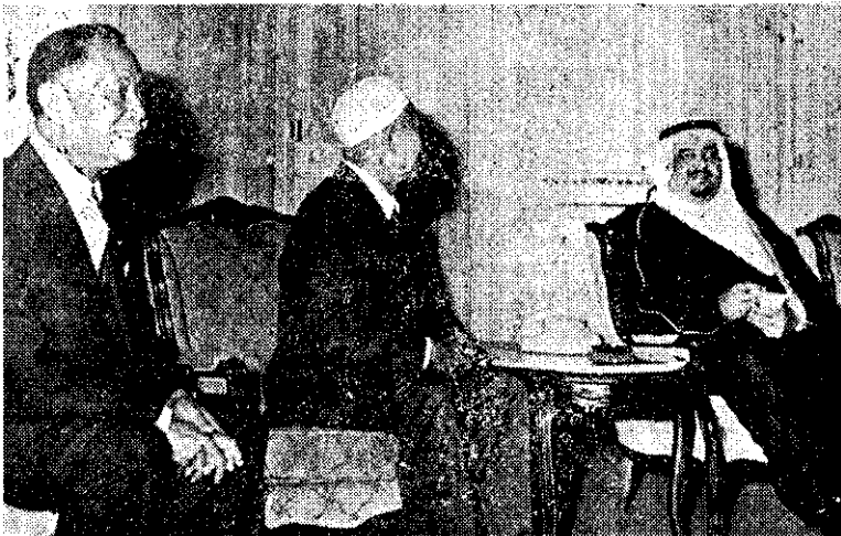
——沙國法赫德親王11月中接見我國回教朝覲團，重申兩國友誼——

公告中說：實際種植稻作農戶所需稻作肥料，可以全部貸放。等當期稻作收穫後，以現金或稻穀折價償還；也可以