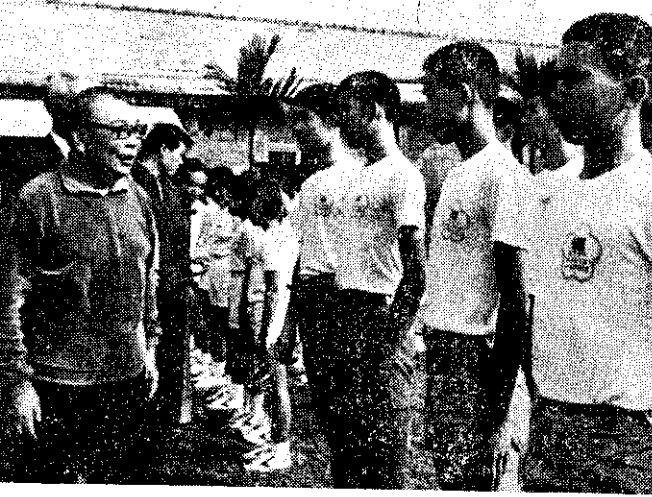
蔣經國總統11月17日巡視左營運動員訓練中心

中毒事件，以氫氰酸（氰化氫）中毒成分居多。因大社工業區的工廠經過處理後的廢水，若仍有氫氰酸，如含十個PPM，經氣溫達到攝氏三十八度蒸發時，就會使人畜中毒。 行政院衛生署副署長林朝京十一月二十七日正式建議：產製危險性化學品的工廠，應隨時備有解毒救治針藥。衛生署環境衛生處長莊進源指出，大社工業區氫氰酸外洩事件，顯示了成立公害防治專責單位的迫切需要。