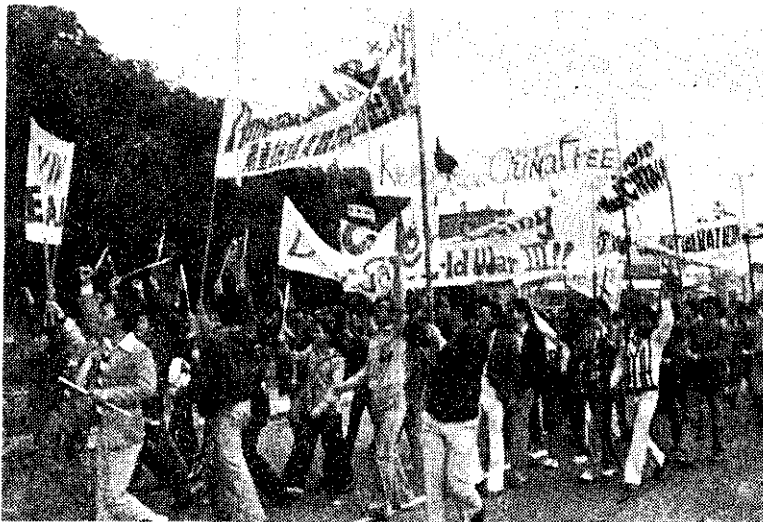
美國談判代表來華，我青年羣衆高舉標語，抗議美國背信行爲