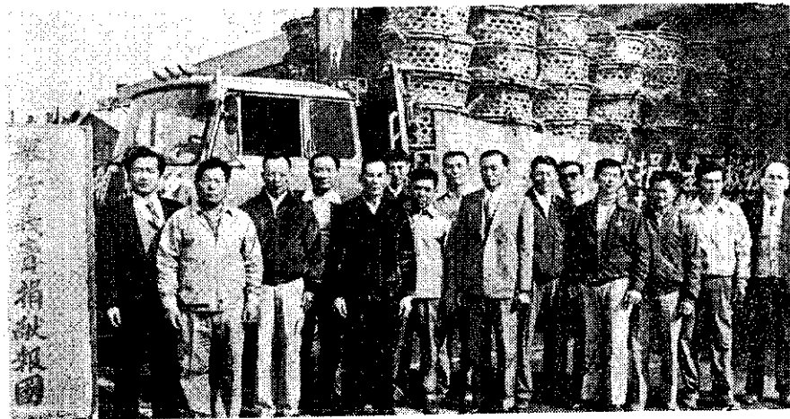
阿蓮鄉養鴨農民義賣白鴨3,000隻作為自強救國基金

貸款的金額每戶最高原為10萬元，修正為20萬元。同時為簡化手續，貸款年息由10%，降低為8.5%，每3個月繳息一次。