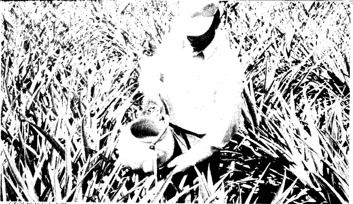
夏季鳳梨電石水處理