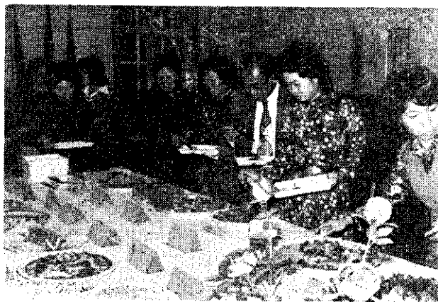
中和鄉地區烹調訓練成果品嚐會(洪社餘)

公館 鄉農會於12月29日(67年)上午9時，在農會召開機械插秧工作座談會，由總幹事羅金海主持，育苗中心負責人及全鄉機械插秧隊員25人參加。