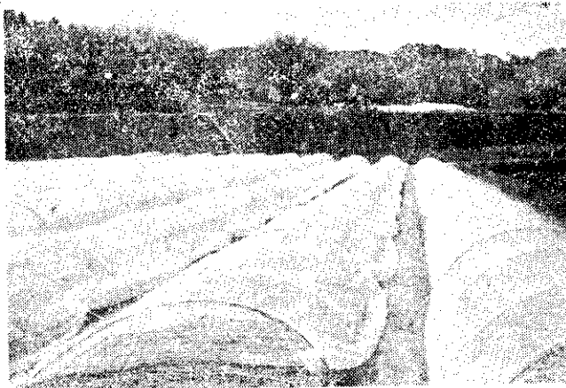
苗床上設隧道棚，上鋪塑膠紗，雨天防雨，晴日遮陰，並可隨時取下通風。

海拔500~2,000公尺地區，是樹木生長量最多的重要造林區域。此地區比較淺山、地形較陡、交通不便、雜草密茂的區域，造林成本及木材生產費用均高，應選擇貴重樹種，以達最高效益。本省固有樹種中，台灣杉( Taiwania cryptomerioides Hay)、巒大杉( Cunninghamia Kanishii )、肖楠( Calocedrus formosana )，木材紋理美觀，品質優良，為名貴家具及建築用材，價值極高，可加以推廣。