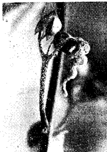
龍吐珠枝條及花朵感染灰黴病

即萬力Benlate) 3,000倍，甲基多保淨 (Topsin M) 1,500倍，鋅錳乃浦 (即大生 M45) 600倍，蓋普丹 (Captan) 800~1,000 倍等，每隔 1~2 周噴施 1 次，遇陰雨時要酌情增加噴藥次數。