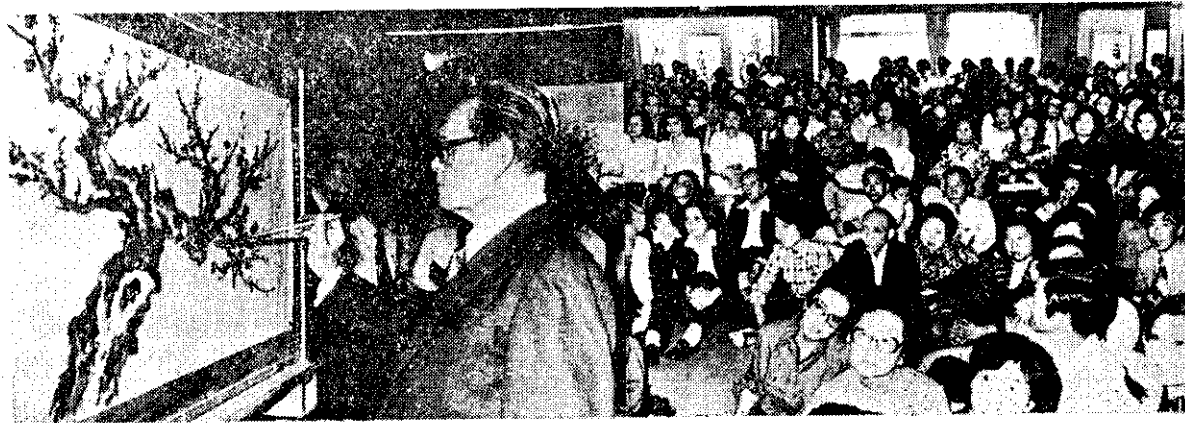
國畫大師黃君璧在台北「我愛梅花美展」會場畫梅示範。

以農家平均消費傾向來說，已由 65 年的 81% 降為 79%，即可支配所得中用於儲蓄部份由 19% 增為 21%，顯示農家儲蓄能力加強。而消費支出中食物費所占比例，也隨所得提高下降，由 65 年的 49%，降為 46%，顯示農家消費型態改變。