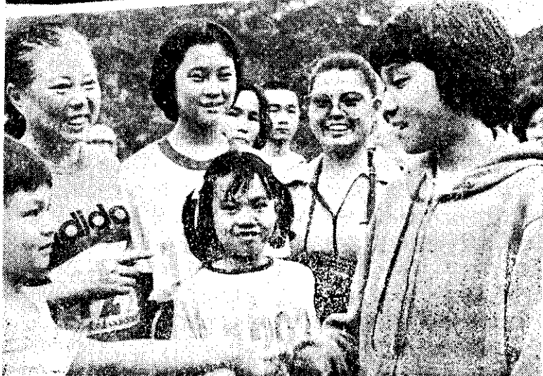
上：行政院孫院長頒發68年青年獎章得獎人。