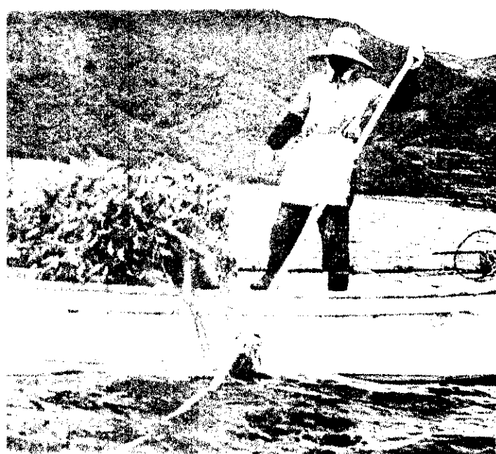
左：以長竹竿結附，作為投放標記。 右上：揚起圍網，將卵羣投到網外側。 右下：定置網捕撈蓄養的烏賊，移入箱網中。