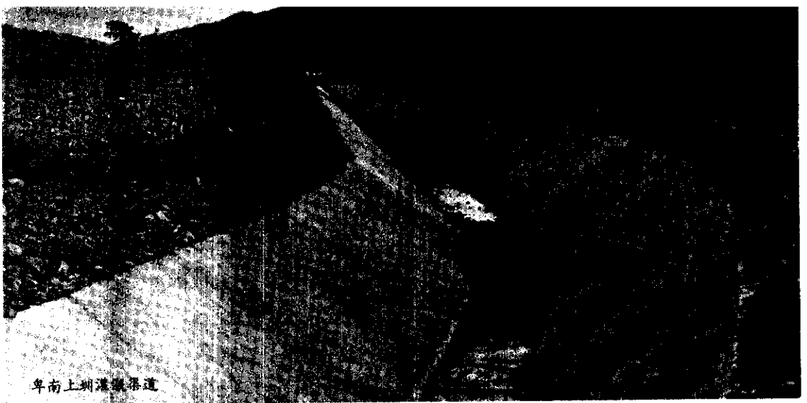
卑南上圳灌溉渠道