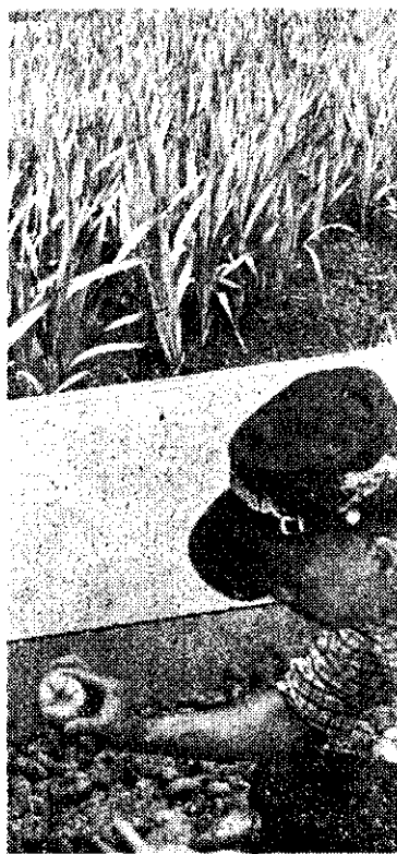
上：唐菖蒲田間生長 下：唐菖蒲球莖