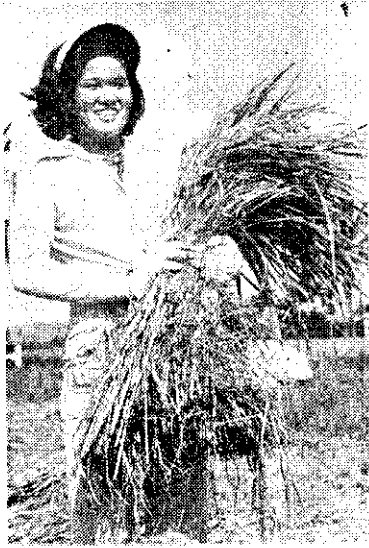
高屏地區開始收割水稻，一位美麗農村姑娘抱着一束金黃色稻子，喜上眉梢

面相片，另備同式相片一張（貼新照使用），免辦體檢及體能測驗，並攜帶身分證，換照通知單及規費台幣65元，前往指定地點的窗口辦理。