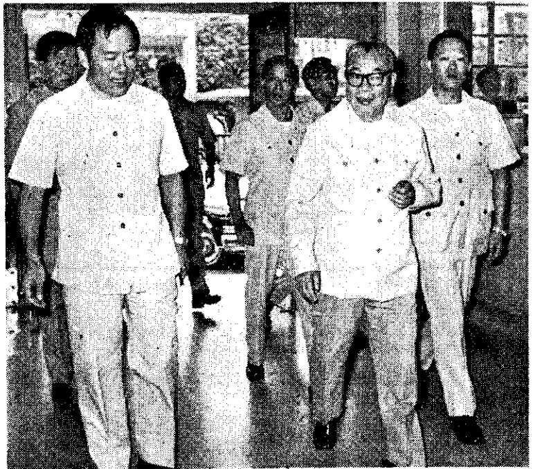
蔣總統經國到農發會巡視，主任委員李崇道(左)在門口迎接

公路局請駕駛人在接到換發通知時，準備申請書（各監理所站均有出售）汽車3份、機踏車2份。貼妥本人最近正面脫帽半身2寸光