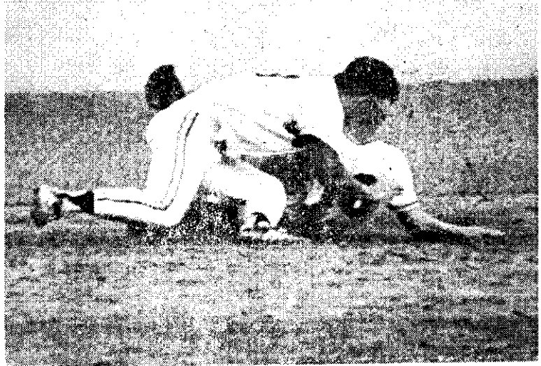
全國成人棒球秋季大賽在台北市舉行（中央社）

塩漬產品生產成本中原料占66%，其次為塩費9%，再次為工資與運費。農發會希望業者應透過農會，在原料方面與農民製作，確保原料供求，業者之間勿作惡性競爭，並加強產品研究，擺脫以原料及半成品方式出口，研製塩漬蔬果成品出口。同時加強市場情報的收集分析，掌握外銷契機。