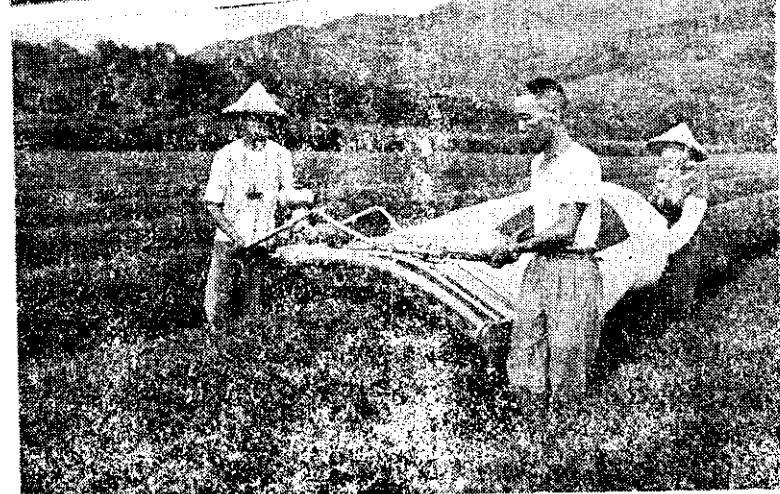
上：謝副總統巡視新屋鄉奇魚養殖情形