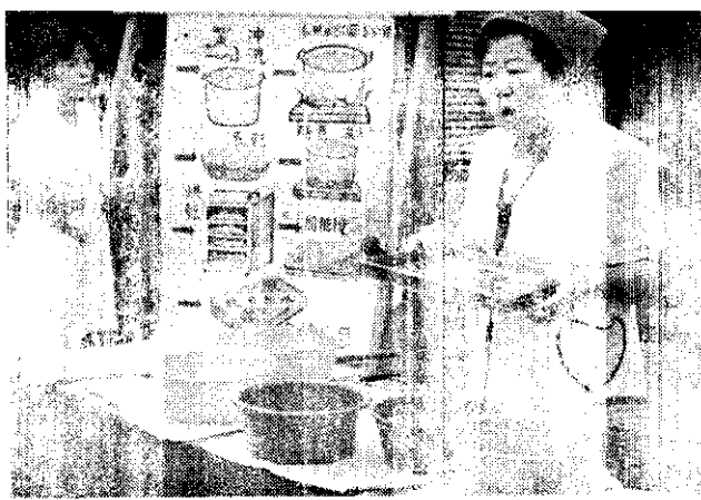
家政班員方法示範

活水準更形落後。另計畫內容不應比照西部，應視東部的環境另行擬訂內容，希望有關單位能重視這個問題。