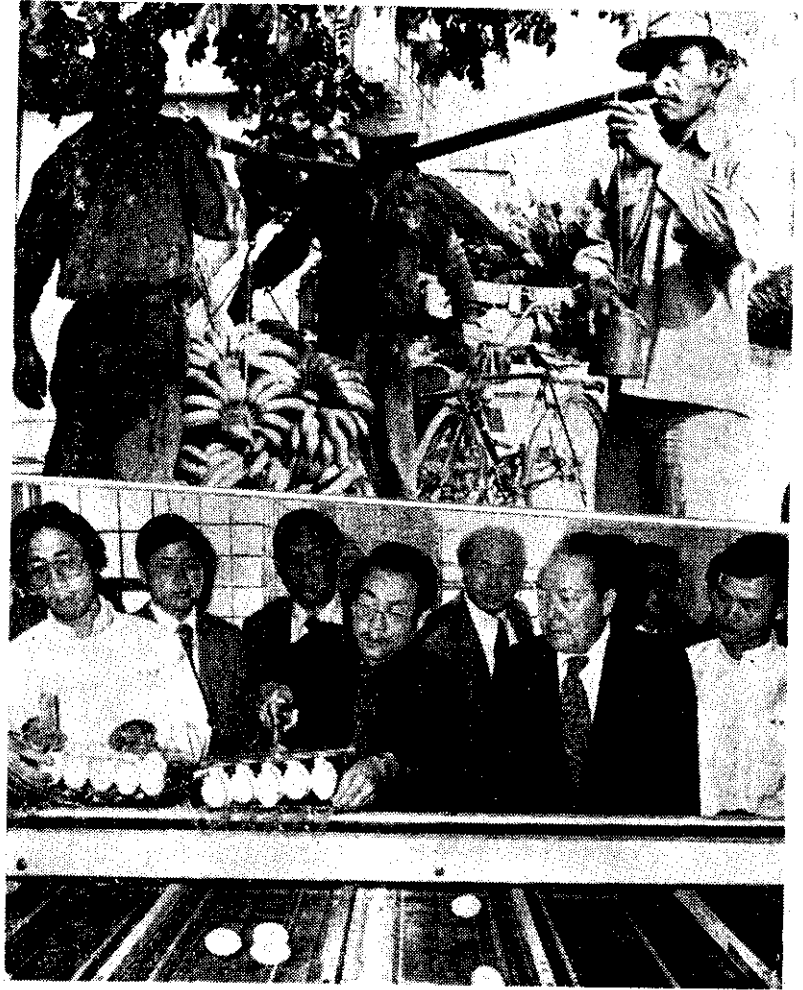
上：屏東地區的外銷香蕉開始採收

廢耕農地限期未恢復耕作者，加徵應徵賦額3倍之荒地稅。農地廢耕時間過久政府照價收買。