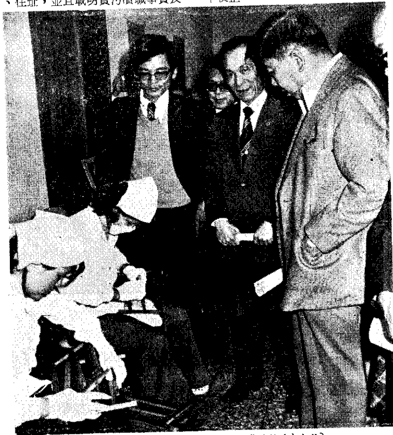
省養蜂協會在農發會介紹蜂王乳採蜜過程

春元冬防工作往年是在春節前1星期開始，至元宵節後1星期結束，爲期1個月。這次不僅提早，而且延長爲85天，至明年3月3日午夜止。