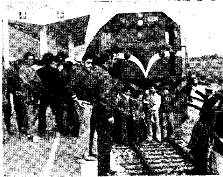
北迴鐵路試車，停靠和平車站。

修正草案第3條第2項規定，委託經營不以租佃論，可解除一般人對委託經營的顧慮，樂於委託經營。第20條之一規定，農業院校畢業青年可購置農業用地。第21、23條限制農業用地應由一人繼承，並有購買農地可以貸款的規定。