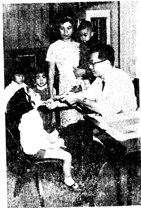
—— 口腔保健 ——