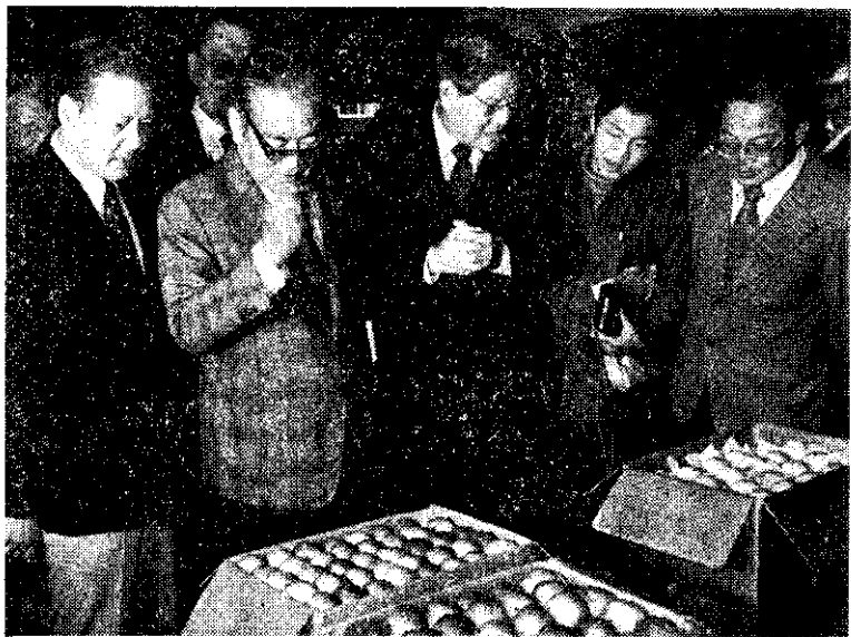
行政院副院長徐慶鐘(左二)春節前視察台北果菜魚市場

僑委會指出，就去年僑胞回國人數增加情形看，僑胞對政府的向心力有增無減，與自由祖國各種關係益趨擴展。同時由於國內經濟建設發展，社會安定繁榮，以及僑胞回國申請入出境手續之改善，也是吸引僑胞大量回國的原因。今後將不斷改進有關措施，加強服務，簡化入出境手續，使僑胞高高興興的回國。