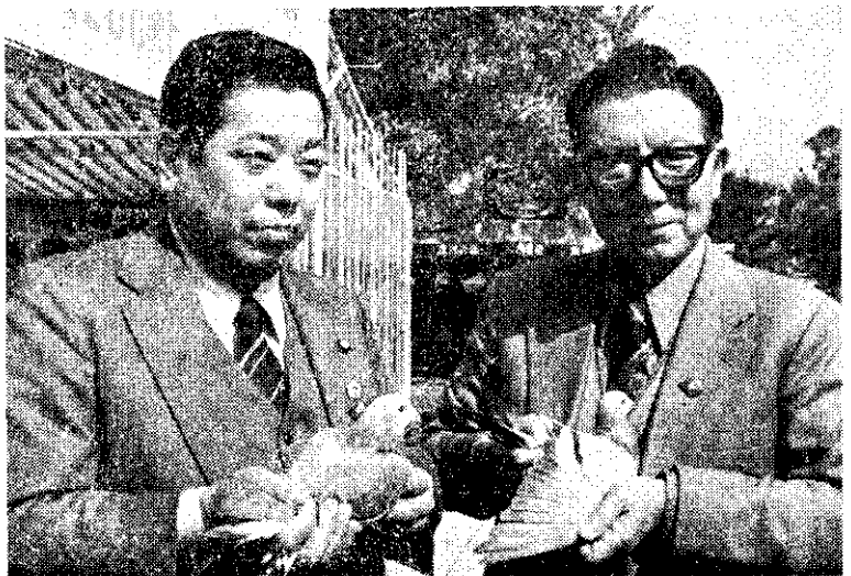
獲亞洲錦鴿品評大會冠軍的英國種鴿子（左）和亞軍鴿子（右）

另外，國民中學及私立初級中學教職員的薪資所得，凡是在68年1月1日以後取得的，依修正所得稅法規定，免納所得稅。