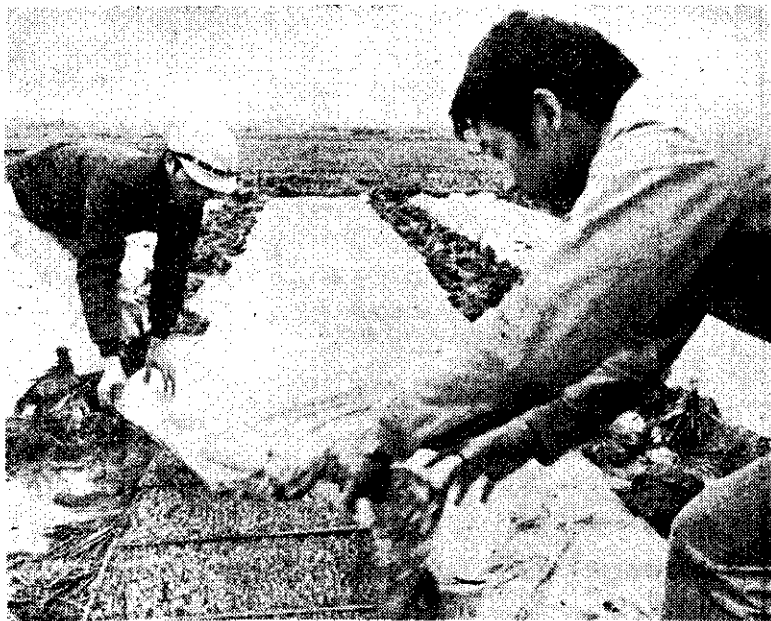
稻苗覆蓋膠布預防寒流侵襲

中央銀行委託台灣銀行自2月25日起在台灣地區發行台幣1,000元及500元鈔券，與其他面額紙幣