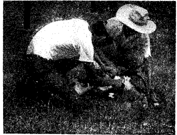
仔牛臍帶炎消毒 (吳則雄)