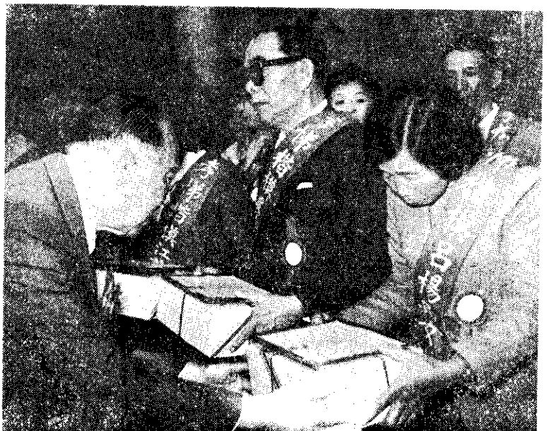
台灣省北區孝悌楷模表揚大會（中央社）

蔣主席指出，農地重劃對於推展農業機械化工作非常重要，希望由原定10年，提前在5年內完成。